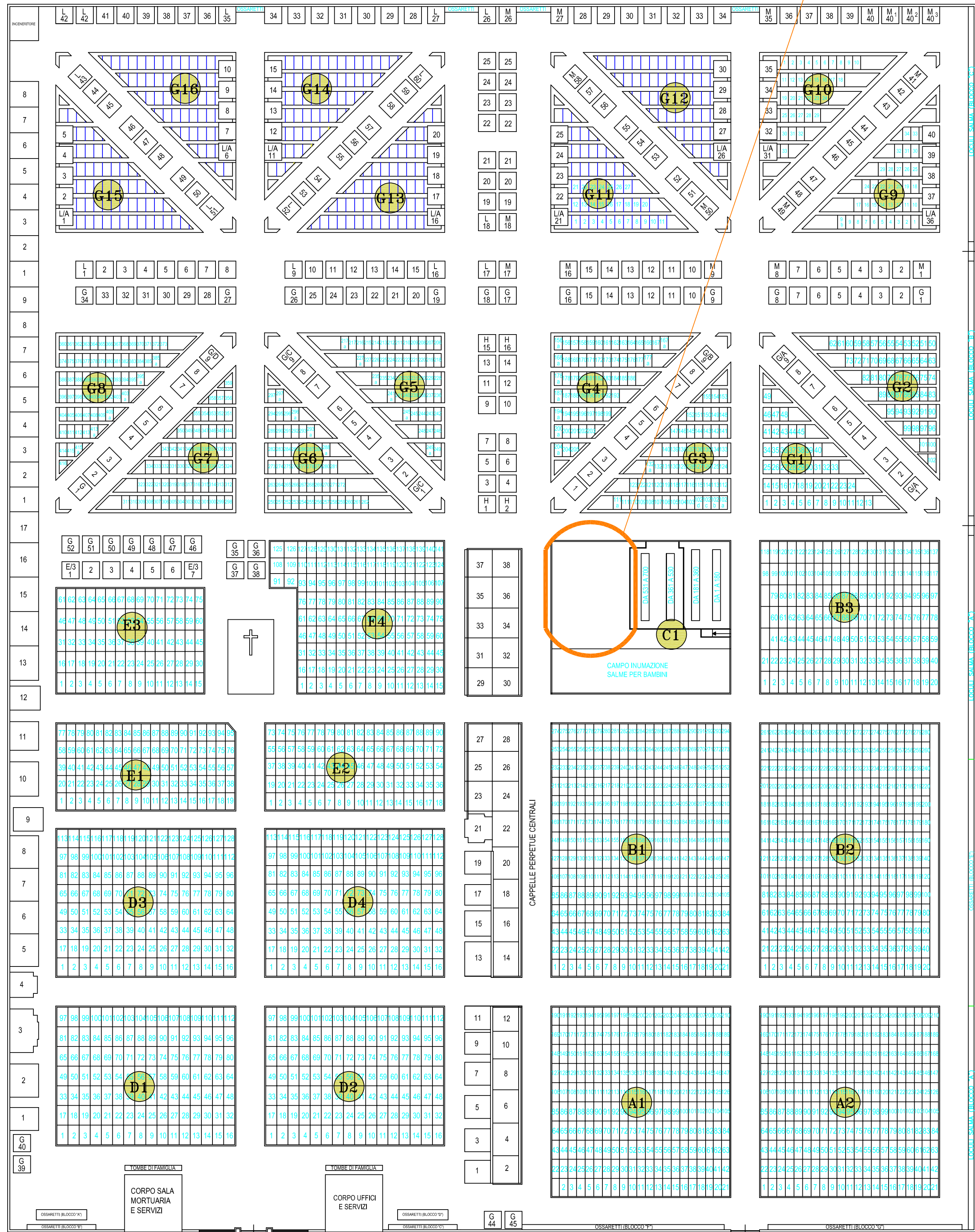
Planimetria Cimitero Sc. 1:500